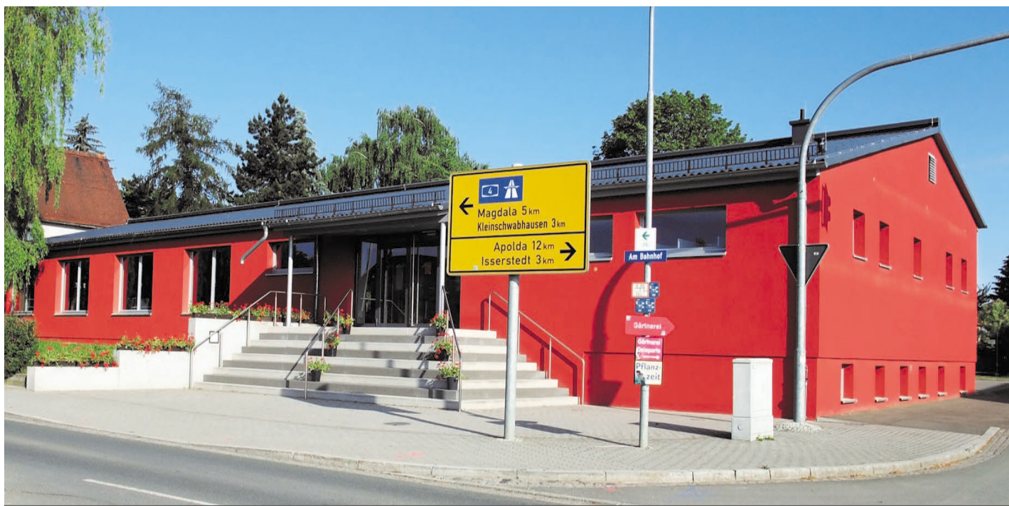
Bürgerhaus der Gemeinde Großschwabhausen