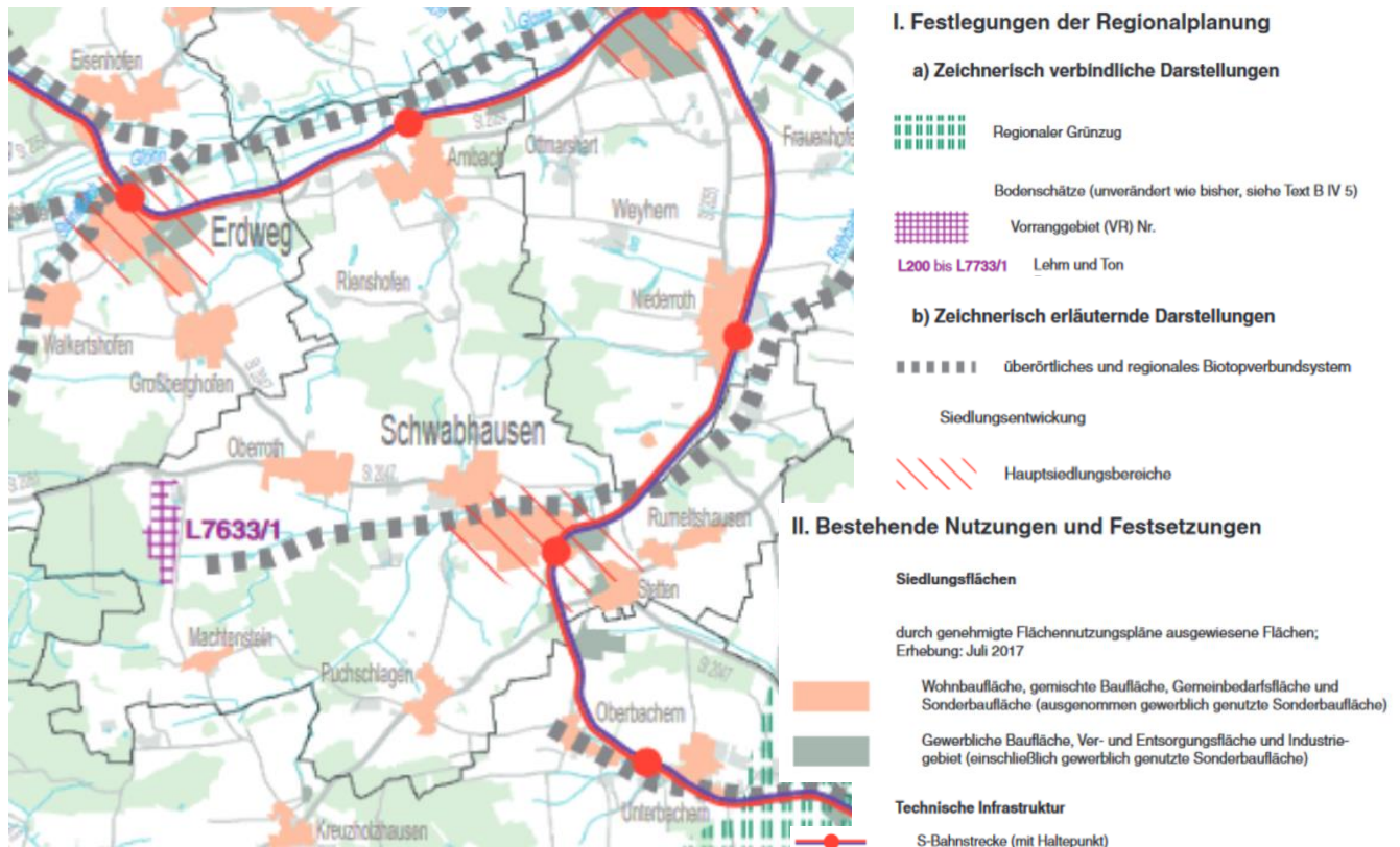
Ausschnitt aus Karte 2 Siedlung und Versorgung (Regionalplan München 2019)

Die Gemeinde Schwabhausen zählt gem. Regionalplan München zum allgemeinen ländlichen Raum.