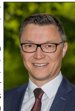
Wolfgang Hörl Erster Bürgermeister