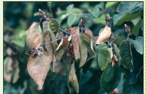
Feuerbrand am Quittenbaum