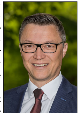
Wolfgang Hörl Erster Bürgermeister