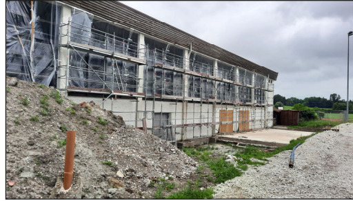
Bild oben: Die westliche Hallenseite ist derzeit ohne Fenster. Die Geräteräume wurden abgerissen. Bild rechts und unten: Der Innenbereich der Heinrich-Loder-Halle ist komplett eingerüstet.

Ab dem 13. September 2022 wird die Sporthalle im laufenden Betrieb saniert. Das heißt, die Spielflächen sind vorerst wieder verfügbar, aber es wird zu Einschränkungen kommen, wie z. B. Sperrung der Umkleidekabinen.