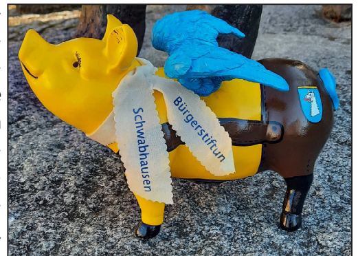
Ein Geschenk der Sparkasse an die Gemeinde: Das Sparschwein der Bürgerstiftung Schwabhausen.

Die Bürgerstiftung verwirklicht gemeinnützige und mildtätige Stiftungszwecke, insbesondere in folgenden Bereichen: Jugend- und Altenhilfe, Kultur/Kunst/Denkmalpflege- und Denkmalschutz, Bildung und Ausbildung, Naturschutz und Landschaftspflege, Sport usw. Weitere Informationen erhalten Sie im neuen Flyer der Bürgerstiftung Schwabhausen, den Sie auf der Homepage der Gemeinde unter www.schwabhausen.de abrufen können. Hier finden Sie auch den Antrag, der zur Förderung Ihres Projekts bei der Gemeinde Schwabhausen zu stellen ist.