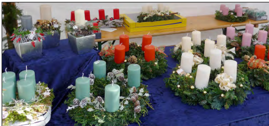
Ein bisschen Weihnachtsstimmung in Schwabhausen, trotz abgesagtem Christkindlmarkt.

Leider musste aufgrund der aktuellen akuten Corona Pandemie der Schwabhauser Christkindlmarkt in diesem Jahr abgesagt werden. Dennoch möchten wir Weihnachten und einen besinnlichen Einklang in den Advent nicht ganz ausfallen lassen.