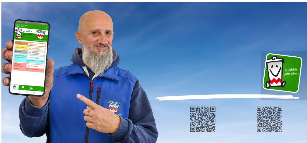
Bild: Plakat zur Digitalisierung Entsorgungskalender

Für Fragen steht Ihnen die Abfallberatung unter 08131 741469 gerne zur Verfügung.