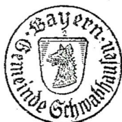
Wolfgang Hörl Erster Bürgermeister

Die Bekanntmachung wurde an den Amtstafeln im Gemeindegebiet Schwabhausen