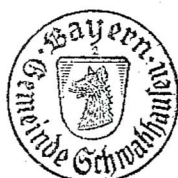
Wolfgang Hörl Erster Bürgermeister

Die Bekanntmachung wurde an den Amtstafeln im Gemeindegebiet Schwabhausen