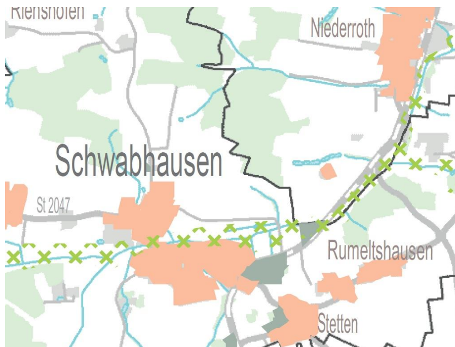
Abbildung 1: Auszug Regionalplan Region München (Karte 3), unmaßstäblich

G 7.4 Die Gewinnung von Sonnenenergie (Strom und Wärme) soll vorrangig auf Dach- und Fassadenflächen von Gebäuden, auf bereits versiegelten Flächen und im räumlichen Zusammenhang mit Infrastruktur erfolgen.