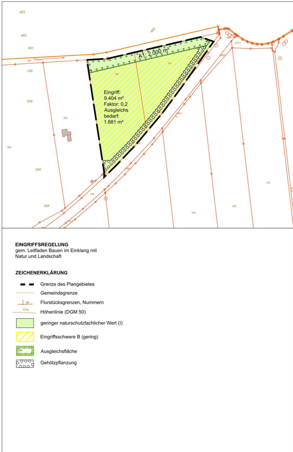
Abbildung 3: Eingriffsregelung (gem. Leitfaden Bauen im Einklang mit Natur und Landschaft)