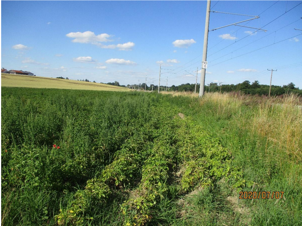
Abbildung 2: Plangebiet, Blick entlang S-Bahn-Strecke in Richtung Nordosten

Aktuell wird das Plangebiet landwirtschaftlich genutzt (Acker).