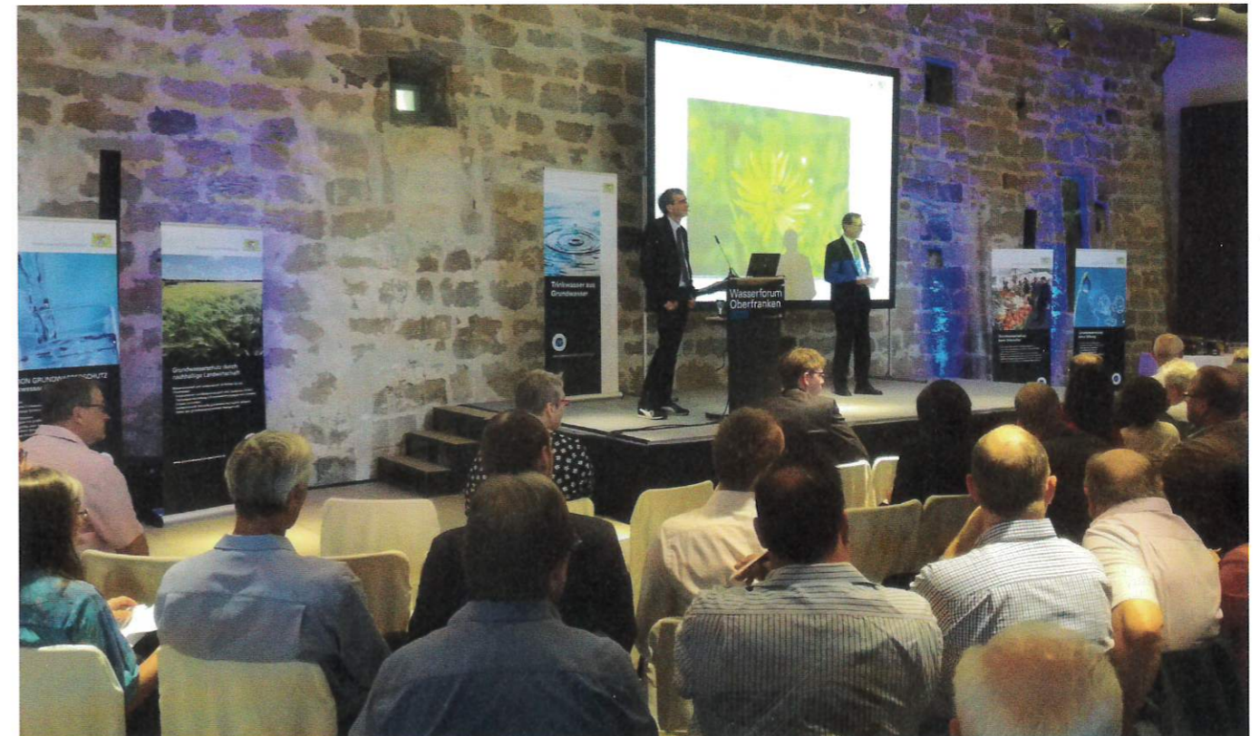
Neben interessanten Vorträgen stellen die Wasserforen der AKTION GRUNDWASSERSCHUTZ die zentrale Austauschplattform für Kommunen, Verwaltung und Wasserversorger in den Regierungsbezirken dar

Weitere Informationen erwünscht? www.grundwasserschutz.bayern.de